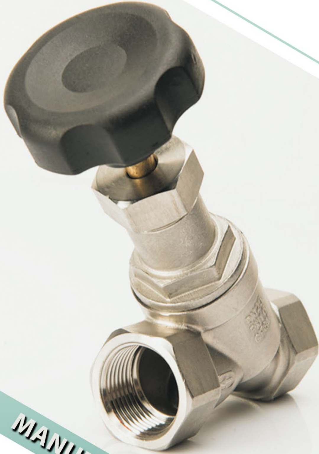
MANUEL PİSTONLU VANA